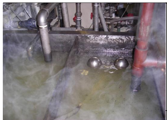
高温仕様エコモアフロート